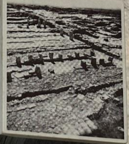
תרביה מבני האורוות הצפונית לחצו במהלך החפירה של משרת אוניברסיטת שיקגו. Most of the northern stables were removed in the course of the University of Chicago excavations.

כל אורווה מחולקת על ידי שני טורים של עמודים נאבטים, שהוצבו לסידור וריגול של יחידות אורך מקבילות יחידה המבצעות שימשה ככל הנראה לעבודות ולטענר בעור שבתחנות הצדדיות וחדו קוסים