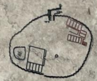
"עיר האורוות" (המאה ה-9 או ה-8 לפסה"ס) 'The City of Stables' (9th or 8th c. B.C.)

"צדתי על שומרון וכבשתיהו 27,290 הושבים בה עם כרכבותיהם נשאתי בשלל 60 רבב [גויסתי לי כחם] למשכר הכלכותי (...)" (העודה אשורית, חלקר סרצון השני (721-705 לפסה"ס) כעיון גידוד של פרמכה כפבלמה ישראל הכבושה ששולם כעבאן 60 CHARIOTS (...)" (ASSYRIAN RECORDS, RING SARGON II 721-705 B.C.) MENTIONS THE RECRUITING OF A UNIT OF CHALOTRY FROM THE CONQUERED NORTHERN ISRAELITE KINGDOM IN HIS ARMY